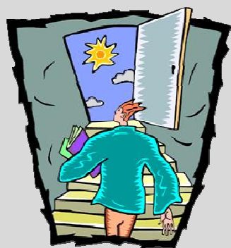
Tableau des répercussions